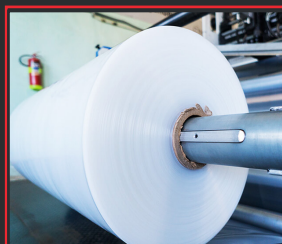
CUBIERTA DE PALETA ESTÁNDAR (80X120 Y 100X120)