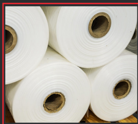
VAINAS TIPO FUELLE (DISPONIBLE DE 4 A 15 M DE ANCHO)