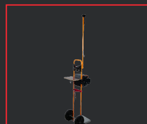
NEUER GASFLASCHENWAGEN 936+