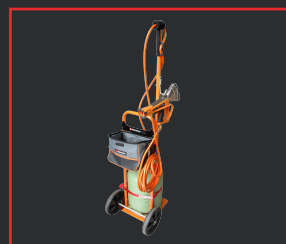
CARRO PORTA BOTELLAS 936