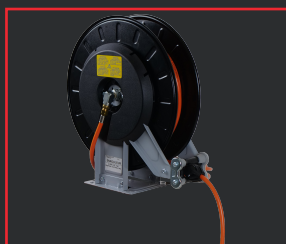
CARRETE DE MANGUERA DE GAS